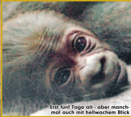
Baby hängt an Muttern Bebe

Das Gorilla-Baby im Zoo ist erst 5 Tage alt und träumt schon von Bananen