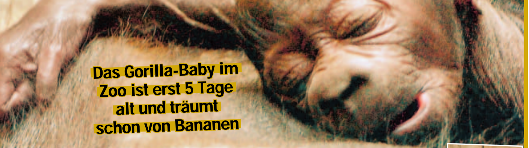
Schweinemüde und übersüß: das Gorilla-Baby im Zoo

Das Gorilla-Baby im Zoo ist erst 5 Tage alt und träumt schon von Bananen