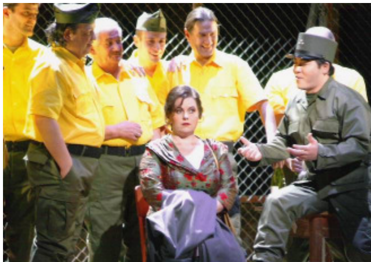
Chorherren • Leitgeb • Yoo / CARMEN

...Desdemona ... ... Piani berückend ... ... Ave Maria geradezu atemberaubend ... ... Kunstgesang ... (OTELLO telezeitung)