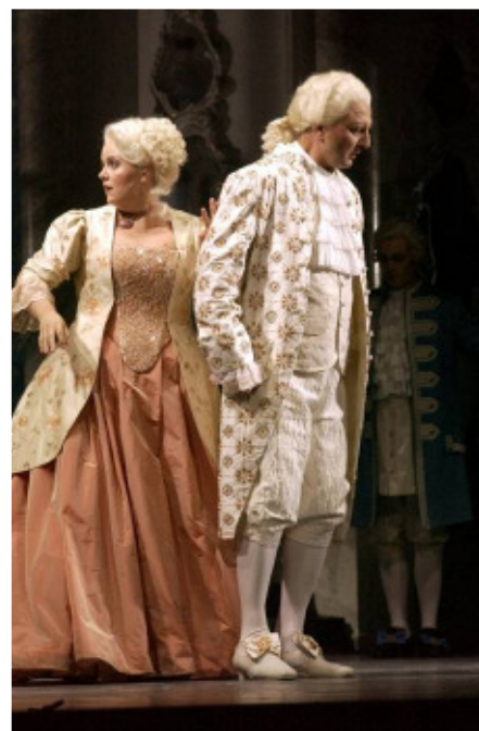
Leitgeb • Krusel / DER ROSENKAVALIER

... große, reiche und dramatische Stimme der Sopranistin maßgeschneidert ist... ... staatsoperntreif... (MEFISTOFELE Opernnetz.de)