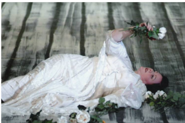
Leitgeb / FREISCHÜTZ