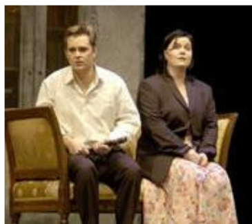
Dankier • Leitgeb / DIE ZAUBERFLÖTE