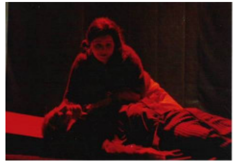
Leitgeb / DON GIOVANNI