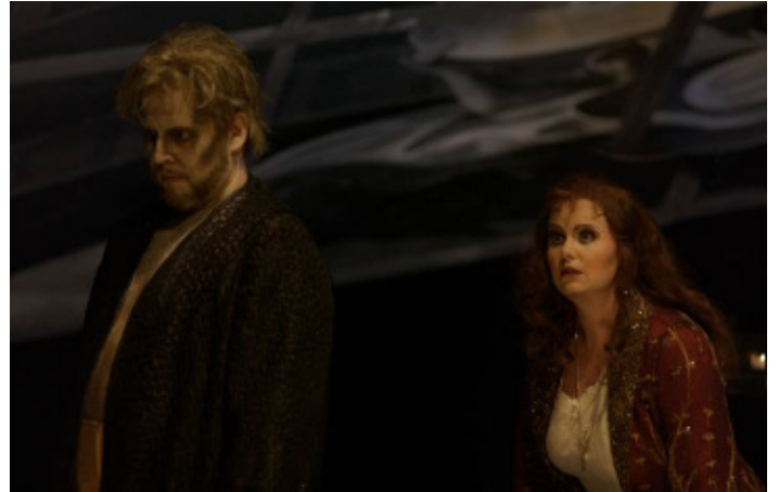
Saevarson • Leitgeb / DON CARLOS

(LES HUGENOTTES Mittelbayerische Zeitung)