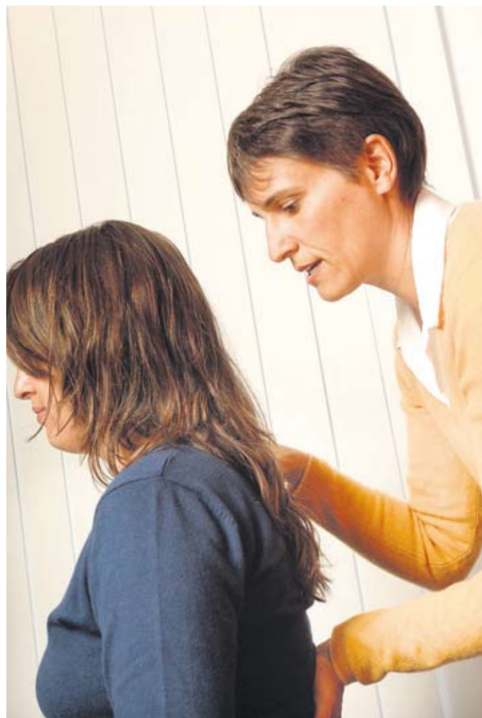
Durch sanfte Impulse zur physiologisch richtigen Haltung.

Informationen zu den einzelnen Methoden unter: www.alexandertechnik.ch www.atlaslogie.info www.biodynamik.ch www.craniosuisse.ch www.kinesiologie.ch www.polarity.ch www.shiatsu.ch