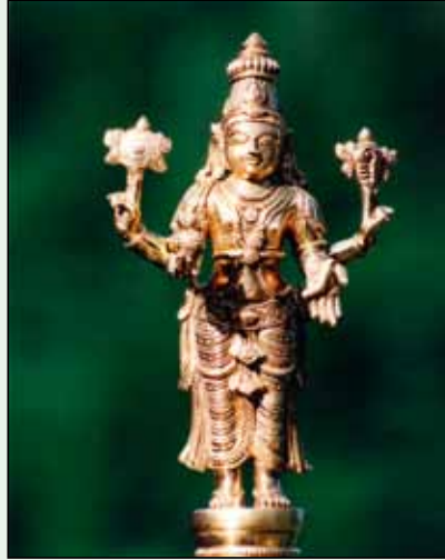
Dhanvantari, der Schutzpatron des Ayurveda

krankmachende Umstände zu erkennen und auszugleichen. Dadurch kann man die Entstehung von Krankheiten von vorne herein verhindern. Von grundlegender Wichtigkeit ist das Wissen über den eigenen Konstitutionstyp (Kapha, Pitta, Vata) und das richtige Verhalten in bezug auf Ernährung, Kleidung, Körperpflege und gesunde Lebensweise.