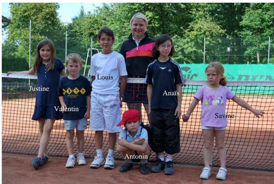
LES PREMIERS INSCRITS...

VOUS POUVEZ INSCRIRE VOS ENFANTS AUPRES DE CAROLINE COLOMB (PROFESSEUR) OU D'ALAIN SALNIKOFF (MONITEUR)