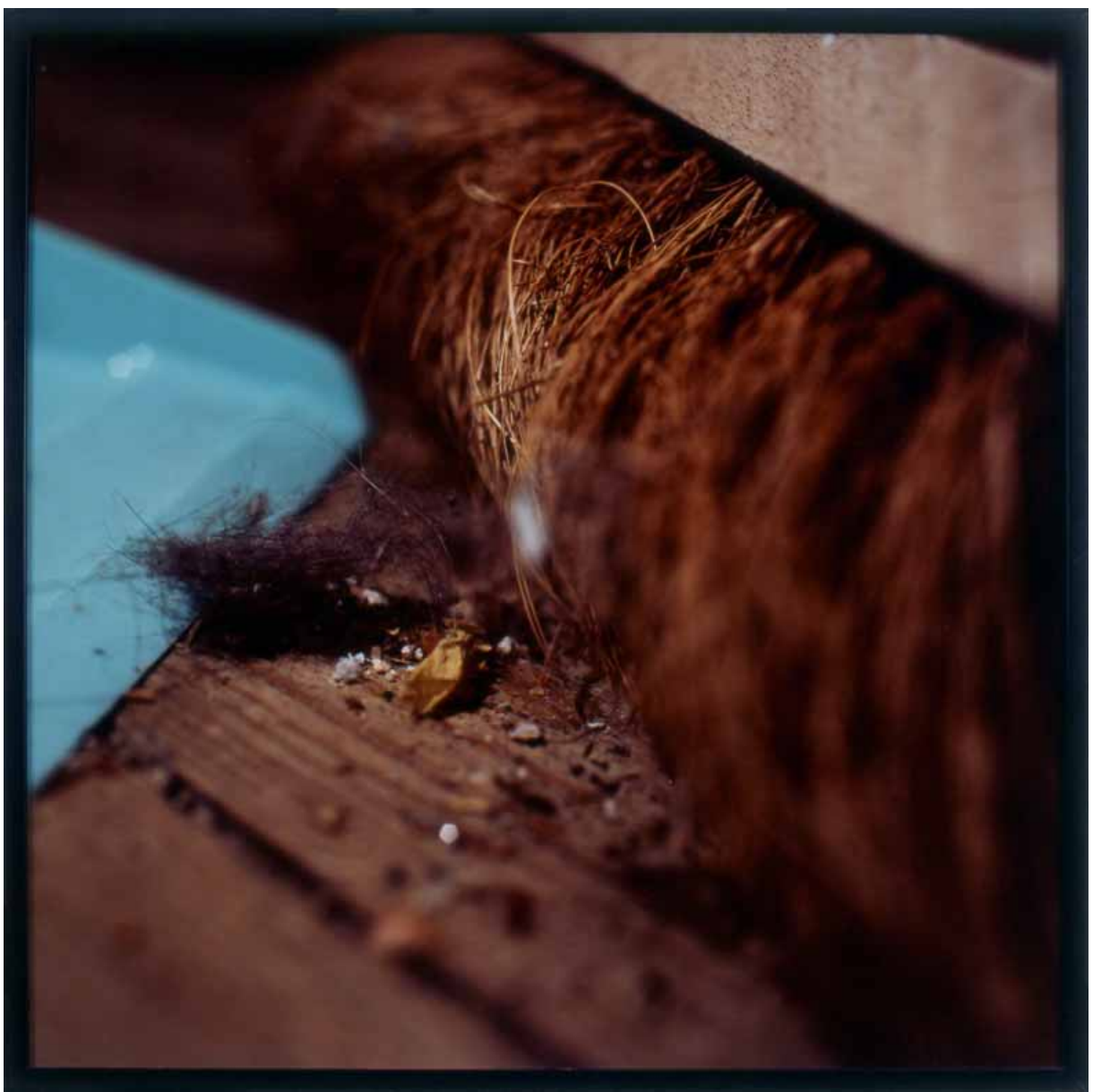
Yves Trémorin, Nature Morte. Poussière.

n'a donc jamais une vue complète de la collection mais découvre chaque fois des œuvres revenues du prêt ou récemment acquises. C'est aussi un des intérêts de ce type de collection que de ne jamais se donner à voir intégralement.