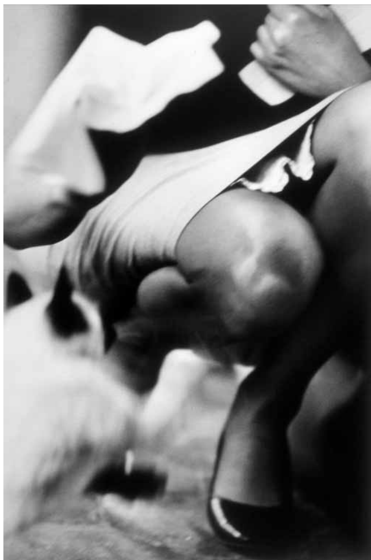
Bernard Plossu, Mexico City 1966.

Décider de mettre de l'art dans son espace quotidien est tout à la fois simple et subtil mais nécessite d'abord de se rendre sur place pour effectuer soi-même le choix des œuvres. Service municipal, l'artothèque ne fonctionne pas sur le registre de la massification mais sur celui, beaucoup plus complexe, de l'individuel. Car les