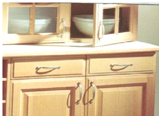
SunCare® 800 + SUNBLOCKER-LACK PU-70

Während der Reaktion mit dem Holz kann eine rötliche bzw. grünliche Färbung auftreten. Diese verschwindet nach der Belichtung mit Tageslicht wieder.