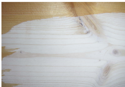
SunCare® 800 WF