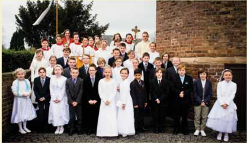
Die Erstkommunionkinder St. Cäcilia, Niederzier

Besonderen Dank an alle, die zur feierlichen Gestaltung unserer Erstkommunionfeier beigetragen haben.