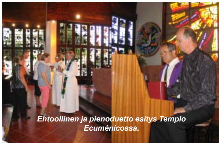
Ehtoollinen ja pienouduetto esitys Templo Ecuménicossa.

Gran Canarian suomalainen ev.lut. seurakunta