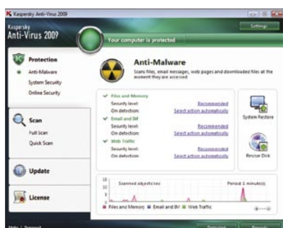
Kaspersky Anti-Virus 2009. Protección Anti-Malware