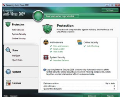
Kaspersky Anti-Virus 2009. Página principal

La nueva interface está diseñada para proporcionar información global y clara sobre el estado de la seguridad y las acciones a llevar a cabo.