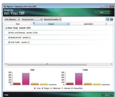
Kaspersky Anti-Virus 2009. Tablas estadísticas