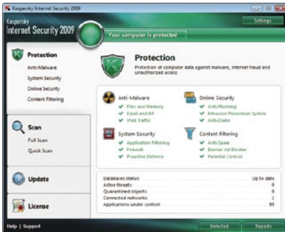
Kaspersky Internet Security 2009. Página principal

La nueva interface está diseñada en línea con el enfoque global de protección de la información.