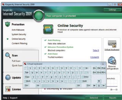
Kaspersky Internet Security 2009. Teclado virtual