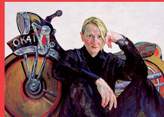
Xenia Hausner: TEMPO Acryl auf Hartfaser 2004