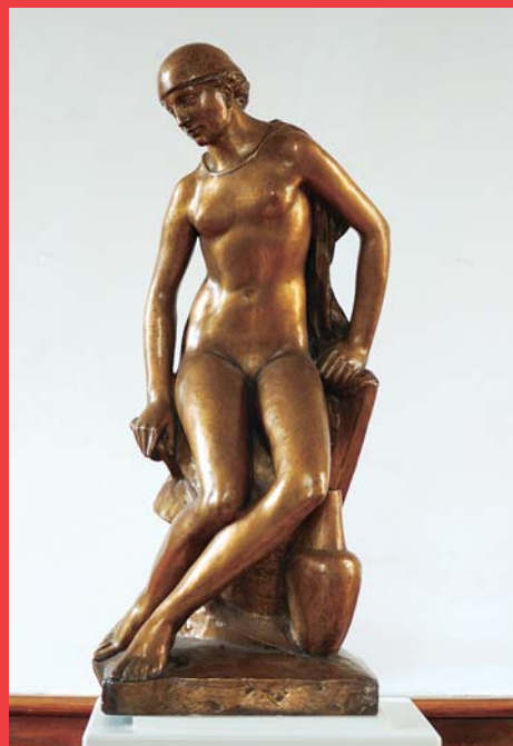
Jan Štursa: „BAUKUNST“ 1917

Výstavou „EXPRESSIONISMUS“ bylo vytvořeno spojení se současným malářstvím. Klasická témata jako portrét, krajina, žánrové scény jsou virtuózně parafrázovány známými umělci. Mezi mnoha dalšími k nim patří: FRANZ GYOLCS, XENIA HAUSNER, WOLFGANG HERZIG, ALFRED HRDLICKA, MARIA LASSNIG, FERDINAND MELICHAR, GOTTFRIED PENGG-AUHEIM.