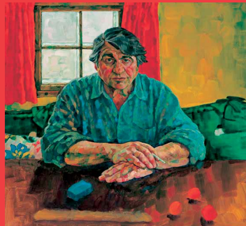
Peter Turrini, Acryl auf Hartfaser, 1997