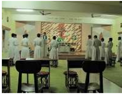
zwei tage erholung im

priesterseminar in sulthan battery. gebet, schweigen, messe mit den seminaristen. anschliessend gespraech.