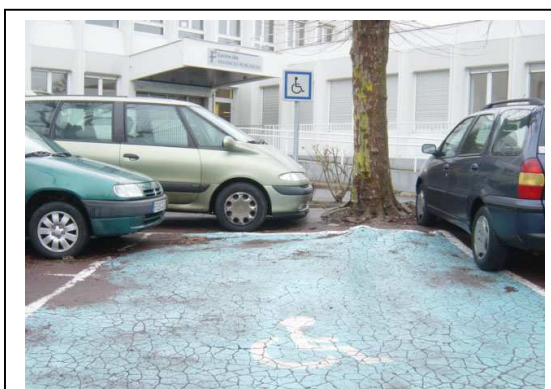
NON : Une place de stationnement "chaotique" aux Finances publiques de Compiègne (60200)