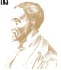
GEROLAMO CARDANO (1501-1576)

Nuestra historia aconteció en la Italia renacentista del siglo XVI. Desde hacía casi tres siglos, las matemáticas se enseñan en las ESCUELAS DE ÁBACO, donde sobre todo se impartía ALGEBRA, y en especial las técnicas para resolver ecuaciones. Aunque las