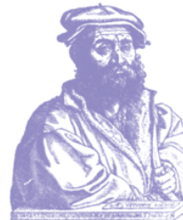
NICCOLÒ FONTANA TARTAGLIA (1499-1557)