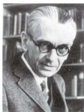
KURT GÖDEL (1906 -1978)

Cuando desde el primer tercio del siglo XX, los matemáticos se adentraron en la computabilidad y en la automatización del razonamiento, encontraron un tipo especial de funciones, las llamadas FUNCIONES RECURSIVAS PRIMITIVAS a partir de las cuales es posible construir todo el acervo matemático computable. Por supuesto estas funciones son recursivas no sólo por su nombre.