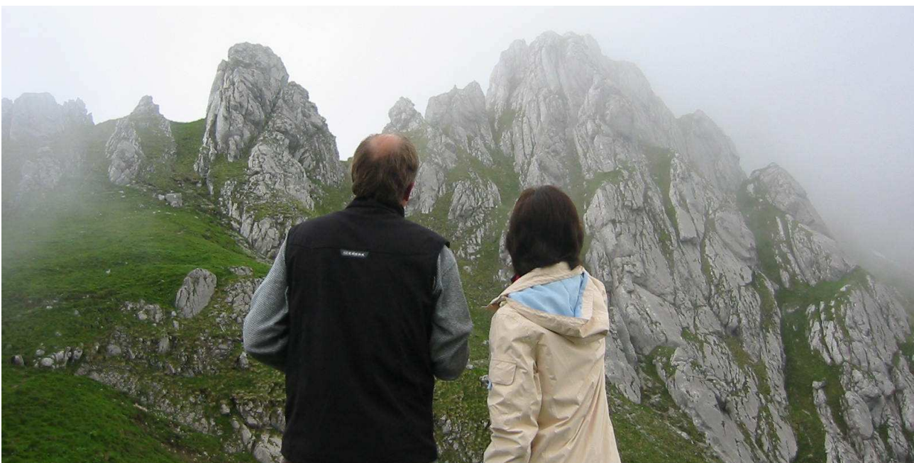
Der Blick von der Torscharte hinauf zum Torkopf, wo man Gämsen und Murmeltiere beobachten kann.