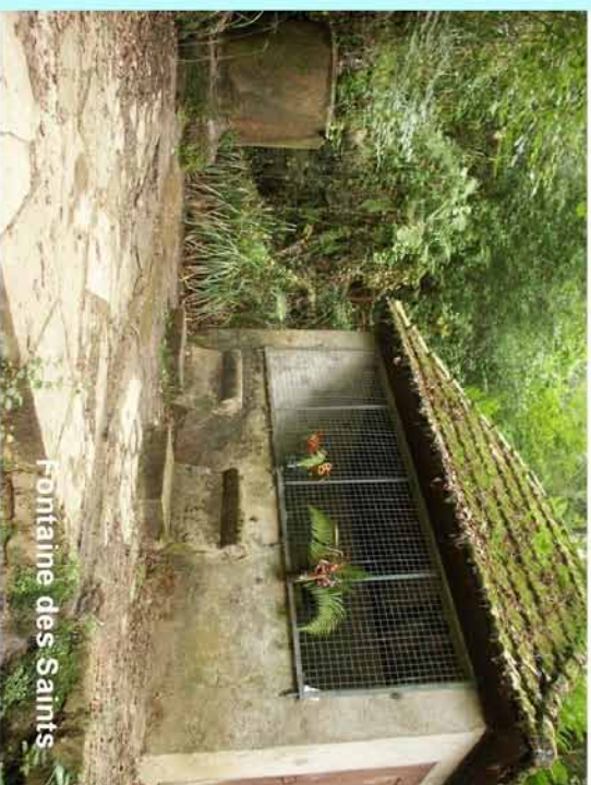
Fontaine des Saints

Parking proche du feu de St Martin de Seignanx (D817 - ancienne N117)