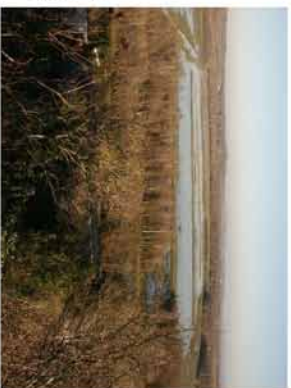
Réserve de Lesgau dans les Barthes de St Martin de Seignanx

La Barthe de " Lesgau et Nastres " est en réserve depuis 1973. Malgré cette protection, l'absence d'entretien et le système hydraulique endommagé font que cette réserve n'attire que peu d'oiseaux.