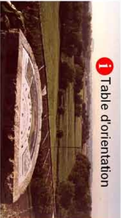
1 Table d'orientation

1 📍 La table d'orientation présente le paysage des Barthes de l'Adour, la chaîne des Pyrénées, ainsi que la faune et la flore locale. Faites le tour du bourg pour admirer l'architecture traditionnelle de la mairie, de l'église et des habitations. Puis passez un premier pont avant de rejoindre le pont du port.