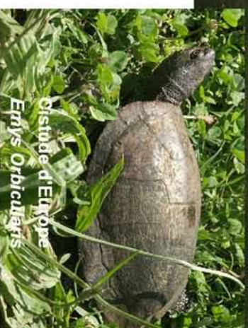
Distributeur d'Europe Emys Orbicularis