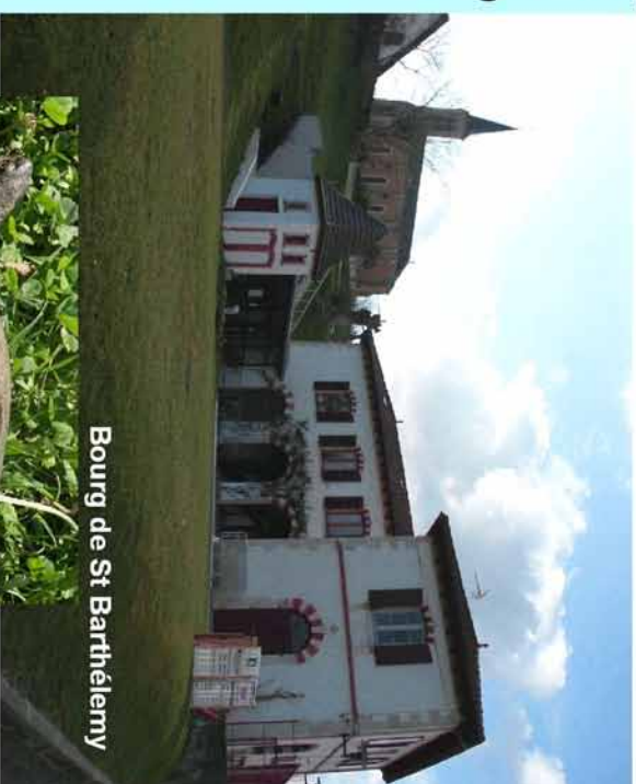
Bourg de St Barthélemy