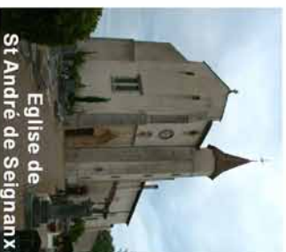
Eglise de St André de Seignanx

Aujourd'hui Saint André de Seignanx est apprécié pour ses maisons bourgeoises, ses châteaux, château du Hitau (16 ème siècle), château de Castets, caverie de Lalanne et pour son église aux fondations romaines. Elle s'ouvre par un portail en pierre du XV ème siècle de style flamboyant, surmonté d'un arc en accolade et orné, sur son tympan, d'une effigie en bas relief.