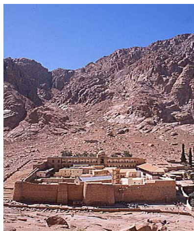
Le Monastère Sainte Catherine EGYPTÉ

Paroisses St André de l'Europe, St Augustin et St Philippe du Roule