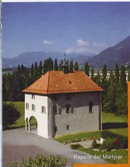
Kapelle der Märtyrer