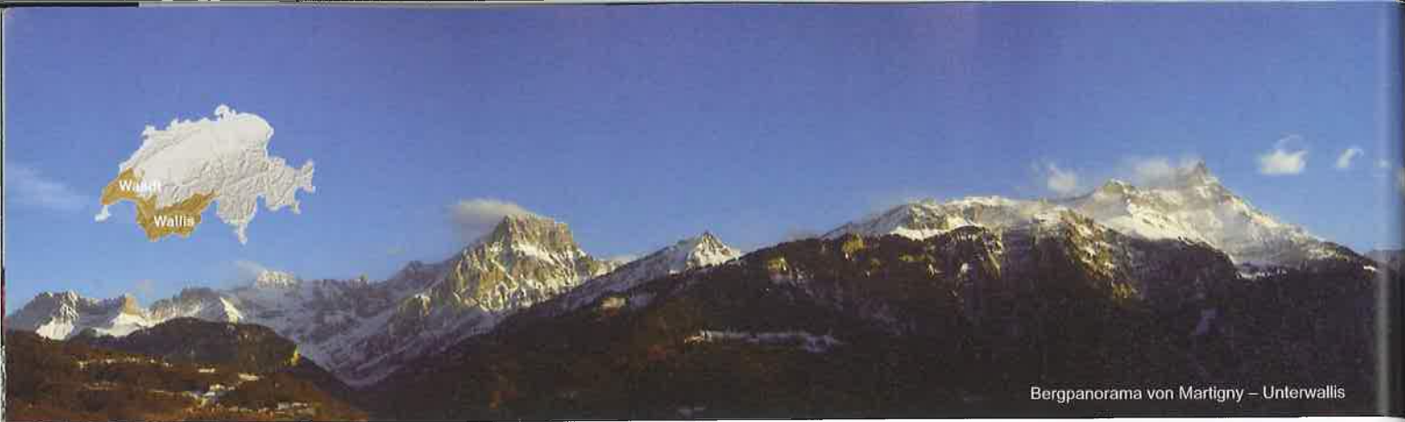
Bergpanorama von Martigny – Unterwallis