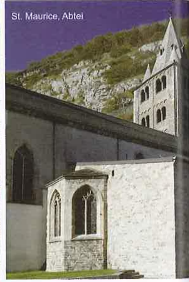
St. Maurice, Abtei