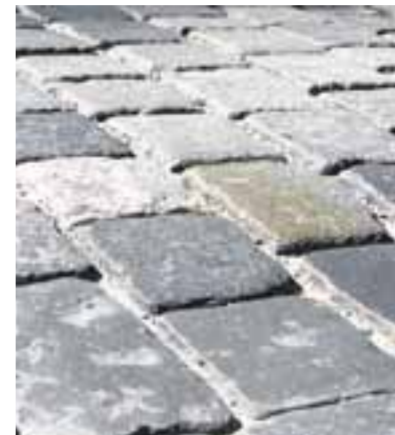
Die Zwischenräume zwischen den Pflastersteinen sind oft sehr tief (hier in der Kirchenstraße).