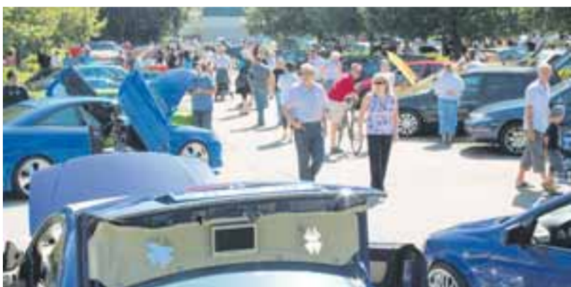
Die Details im Auge: Über 2000 Besucher, so schätzen die Veranstalter, besuchten das Tuningtreffen auf dem Lingl-Parkplatz in Krumbach.