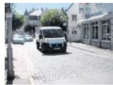
Ein weites Feld: Das Pflaster beginnt bereits an der Ecke Karl-Mantel-Straße/Mühlstraße.