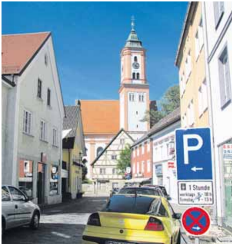
Eine verkehrsberuhigte Zone für die Innenstadt: Diese Idee hat jetzt Bürgermeister Hubert Fischer ins Spiel gebracht. Bild unten im Text eingeblockt: Das Zeichen für den verkehrsberuhigten Bereich.

und wegfahren wollte. Damit war die Kontrahentin nicht einverstanden und rannte dem Wagen nach. Sie versuchte sich am Türholm durch ein geöffnetes Fenster festzuklammern. Dabei stürzte sie auf die Fahrbahn und verletzte sich. Sie wurde zur Beobachtung in die Kreisklinik nach Krumbach gebracht.