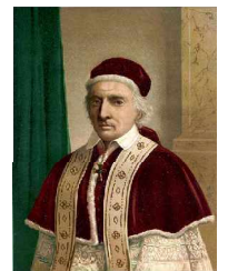
Clément XII né Lorenzo CORSINI à