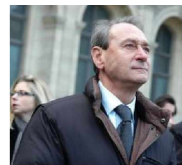
Monsieur Bertrand DELANOE, Maire de Paris Chef de l'exécutif du Conseil Général de Paris

Si cela n'était pas emprunt de corsophobie primaire cette décision paraîtrait presque "ironique".