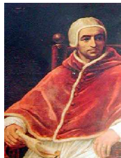
⚡ Benoît XIII né Pierre François ORSINI

A Rome, mort de Benoît XIII, Pontificat de Clément XII