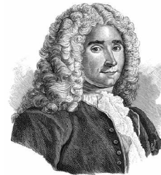
René Antoine Ferchault de Réaumur

REAUMUR invente l'échelle thermométrique. L'espace compris entre la glace fondante et l'ébullition de l'eau est divisé en 80 grades.