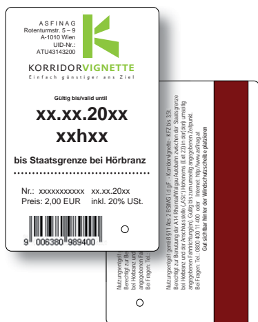
Beispiel einer KorridorVignette für eine Fahrtrichtung/ example for a KorridorVignette for one direction

The KorridorVignette entitles passenger cars and motorhomes up to (and including) 3.5 t maximum gross weight as well as motorcycles to drive along the 23 km stretch (“corridor”) of the A14 Rheintal/Walgau motorway in Vorarlberg between the German border and the Hohenems junction. The following entries and exits are to be found along this route: Hörbranz-Lochau, Bregenz, Wolfurt, Lauterach, Dornbirn Nord, Dornbirn Süd, Hohenems (close to the Swiss border crossing).