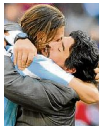
Gemeinsam stark: Maradona herzt Demichelis.

Mitspieler nicht. Solange die FIFA nichts macht, kommen diese Missverständnisse vor.“ Doch trotz seines Aussetzers, für die er auch bei Bayern immer mal wieder gut ist, muss Demichelis kaum um seinen Stammplatz fürchten. Zumal nach der Verletzung von Walter Samuel in der Abwehrzentrale ohnehin die Alternativen fehlen. In der Ära Maradona zählt Demichelis zu den Korsettstangen. „Wie jedem anderen kann auch ihm mal ein Fehler unterlaufen“, meinte der Coach. Anlass zur Sorge gibt die Defensive dennoch. Bisher wurden die Mängel durch die starke Offensive kaschiert. Gegen größere Kaliber werden sich Demichelis und Co. steigern müssen. „Es wird viel über Messi, Higuain, Milito und Tevez geredet. Aber damit sie groß aufspielen können, müssen wir hinten sicher stehen“, sagt der Münchner. Argentinien sei zu einer erfolgreichen WM verpflichtet,