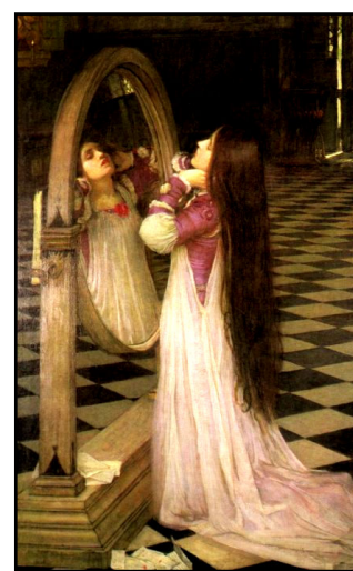
Possedere la Luna-Drusilla negli specchi, dialogare con la sua ombra

Lo spettacolo scandaglia e rappresenta la religiosità romana nel momento in cui, attraverso l'intreccio dei culti antichi con culti di origine orientale, si arrivò alla divinizzazione del potere imperiale (purtroppo scaduto in tirannide), apice e contraddizione di quella continua ricerca di un optimus status che rese tanto grande e indimenticata la civiltà romana.