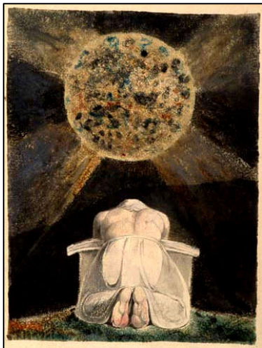
Il lago di Nemi era lo specchio di Diana-Iside-Drusilla.

Gaio Giulio Cesare Germanico, meglio conosciuto come Gaio Cesare o Caligola, fu il terzo imperatore romano, appartenente alla dinastia Giulio-Claudia, e regnò dal 37 al 41. Secondo biografie antiche, beveva perle dissolte nell'aceto e mangiava cibi cosparsi d'oro, con feroce crudeltà infieriva sui senatori romani, teneva un bordello nel proprio palazzo e non si asteneva dall'aver una relazione incestuosa con la sorella. Convinto di possedere natura sovraumana, impose ai suoi contemporanei di onorarlo come un dio mentre era ancora in vita. Egli fu considerato pazzo e morì assassinato in una congiura di Pretoriani, il 24 gennaio del 41. Insieme a lui persero la vita sua moglie Milonia Cesonia e la loro figlia bambina, Giulia Drusilla, così chiamata in ricordo della sorella di Caligola.