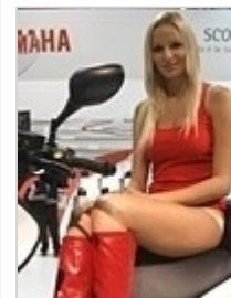
EICMA 2008: Mailänder Messewoche