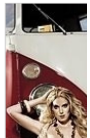
Stahlgruber Werkstatt-Kultu 2009